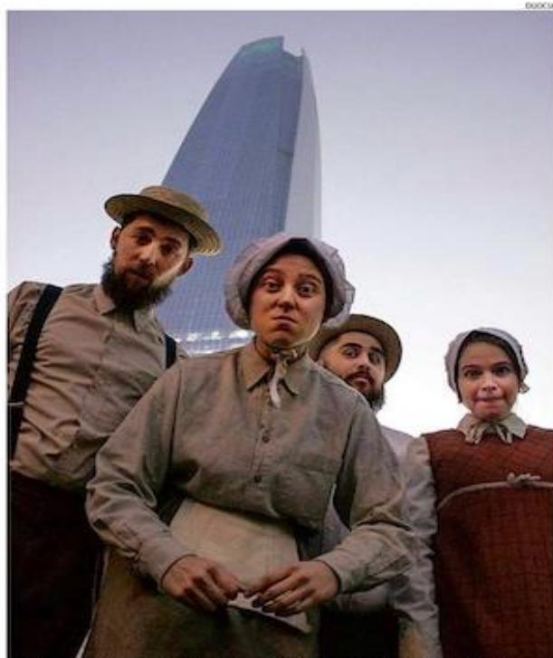
LA ÚLTIMA OBRA DEL CICLO SERÁ "HÍPPE", LA HISTORIA DE LOS ÚLTIMOS COLONOS DE UN PUEBLO AISLADO.