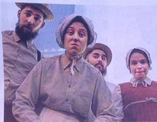
HÄPE SE PRESENTARÁ HOY A LAS 17.30 HORAS EN ISLA NEGRA.