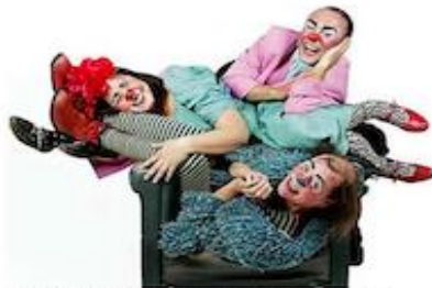
EL FESTÍN DE LA RISA TAMBIÉN ESTARÁ PRESENTE EN EL EVENTO.

Entrada: Liberada, previa reserva a al correo teatro_vina@duoc.cl.