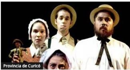
Provincia de Curicó