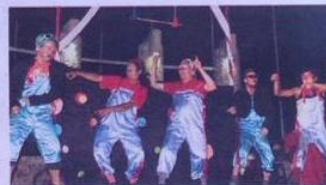
EL SHOW DE LOS HERMANOS TITE TUTATE